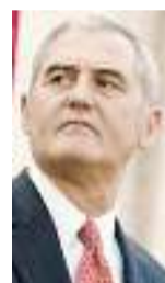
DIPLOMATICO Ronald Spogli, ex ambasciatore Usa a Roma

IL VICEPRESIDENTE Cheney è in arrivo a Roma e Spogli gli dipinge nell'agosto 2008 un'Italia “a rischio di fallimento economico e istituzionale”. «Membro del G8 e fra le maggiori economie mondiali, l'influenza dell'Italia è minacciata dalla crescita economica lenta (...) Il peso della burocrazia, la corruzione, la criminalità organizzata, il tasso basso di natalità, la rigidità del mercato del lavoro, un debole sistema di istruzione e la cultura degli affari che premia i rapporti personali anziché il merito contribuiscono al ristagno (...) La lenta crescita dovuta a questo pasticcio minaccia la capacità dell'Italia di essere il tipo d'alleato che vorremmo». Di più: «Il Paese è a un bivio cruciale, rischia un fallimento economico e istituzionale se non compie difficili scelte in politica interna».